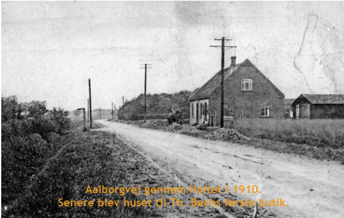
Aalborgvej gennem Holtet i 1910. Senere blev huset til Th. Bechs første butik.