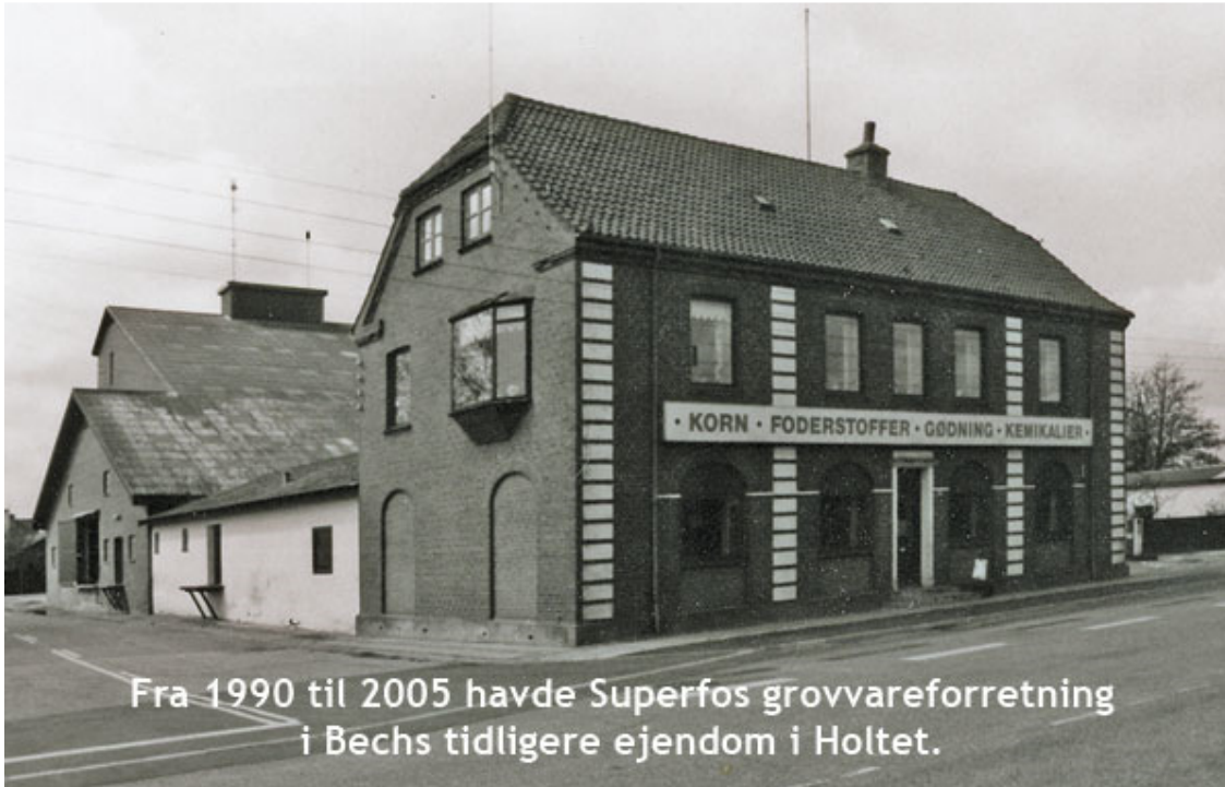
Fra 1990 til 2005 havde Superfos grovvareforretning i Bechs tidligere ejendom i Holtet.