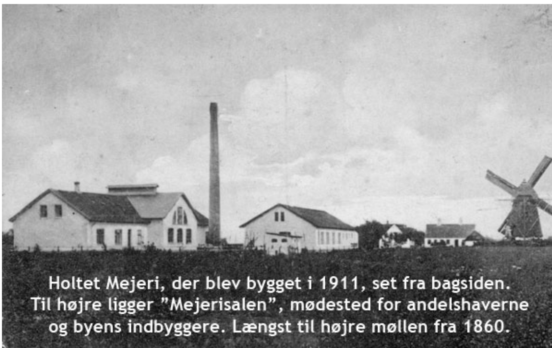
Holtet Mejeri, der blev bygget i 1911, set fra bagsiden. Til højre ligger "Mejerisalen", mødested for andelshaverne og byens indbyggere. Længst til højre møllen fra 1860.